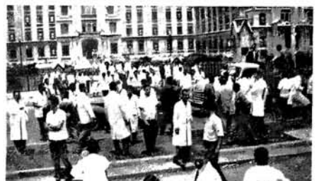
ASPECTO DA MANIFESTAÇÃO CONTRA O AUMENTO DO CUSTO DE VIDA

das Assembléias do Pacto de Unidade Internacional, visitado os sindicatos e suas Assembléias Gerais.