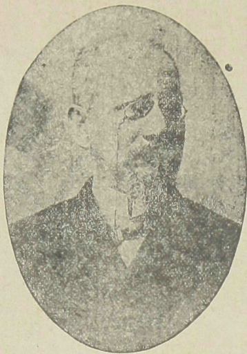
Dr. Rodrigues Alves

A innocentinha falleceu pouco tempo depois do nascimento.