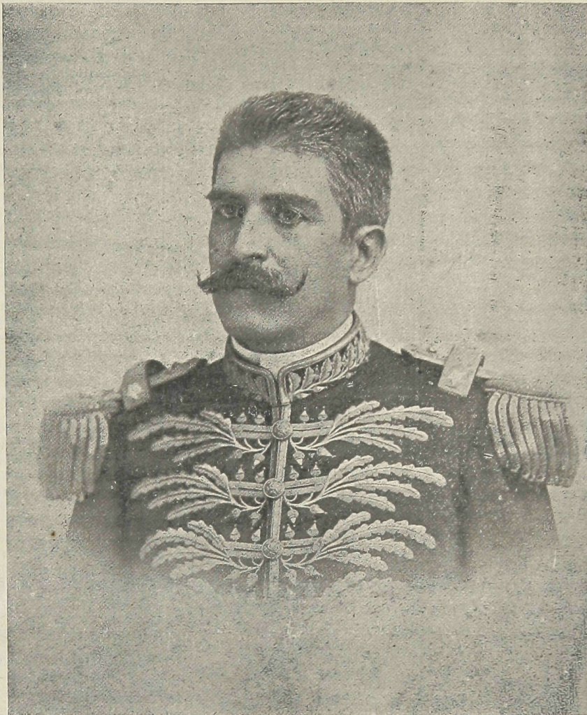
General Luiz Mendes de Moraes

Ao apoio franco que s. excia. tem encontrado em todo nosso Estado, Ytú, a terra da liberdade, de onde brotaram tantos varões, que deram vibrantes exemplos de patriotismo, não podia se manifestar indifferente; e eis com a entusiastica testa deste dia, com a inauguração de hoje, da linha de tiro «General Mendes de Moraes» satisfeita uma das maiores vontades do nosso illustre ministro: difundir a instrucção militar e ensinar á mocidade a amar e defender a terra onde nasceu.