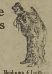
Neahuma é legitimo sem este marca.

Insistir pela original Emulsão de Scott.