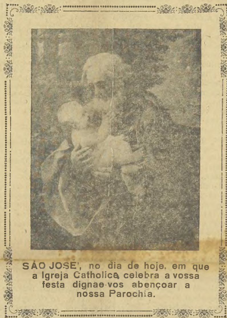
SÃO JOSÉ, no dia de hoje, em que a Igreja Catholica celebra a vossa festa dignae-vos abençoar a nossa Parochia.

Busca sempre o incredulo novas provas da religião, para resistir-lhes como ás outras que